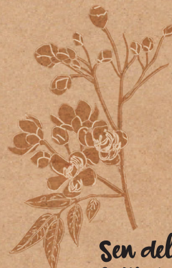
Sen del campo

¡Voy a contarle al Mburucuyá la plantita que está protegiendo a un limoncito frágil!