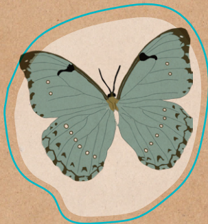
Morpho epistrophus argentinus